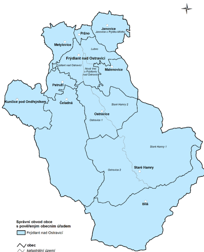
Obrázek 1 Zapojené obce